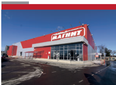
ГМ «Магнит» г. Тимашевск 3400 м2