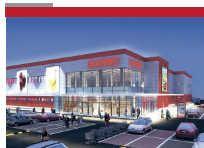
ГМ «Магнит» г. Ростов-на-Дону 15900 м2