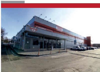
ГМ «Магнит» г. Ейск 5100 м2