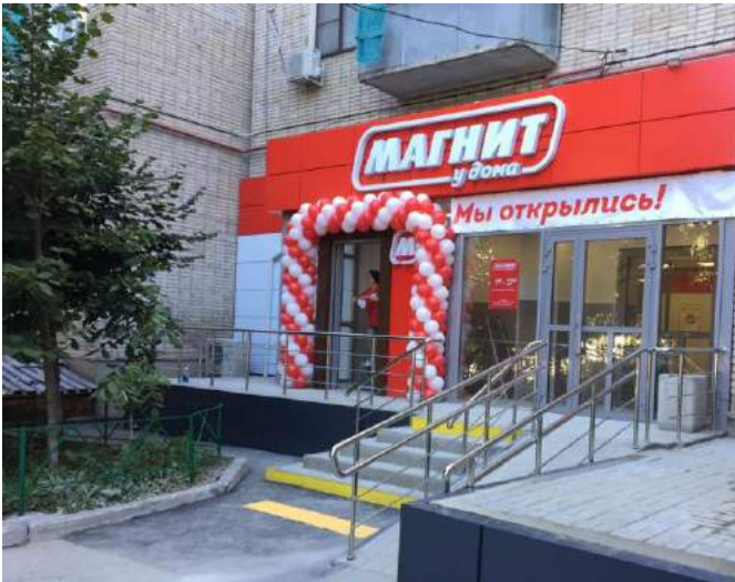
ММ Сироп, г. Ростов-на-Дону 438 м 2