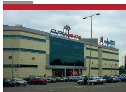
Супермаркет «Перекресток» 3000 м2