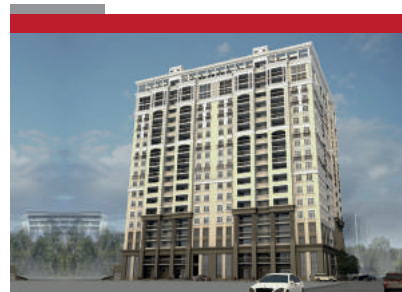
22-этажный жилой дом 27590 м2