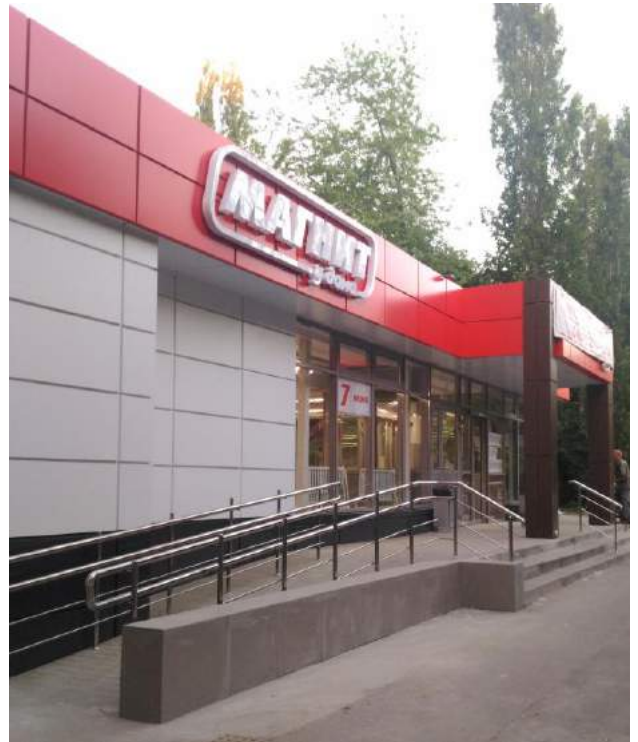
ММ Содружество, г. Ростов-на-Дону 563 м 2