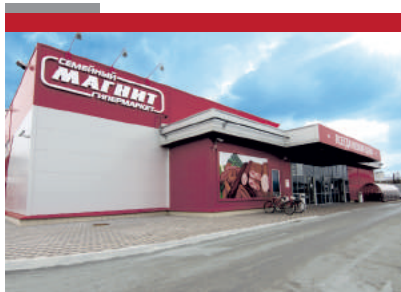
ГМ «Магнит» г. Лабинск 3300 м2