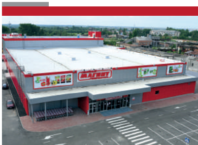
ГМ «Магнит» г. Георгиевск 4400 м2