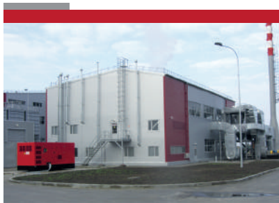
«Мишкино» Кондитерская фабрика 4400 м2