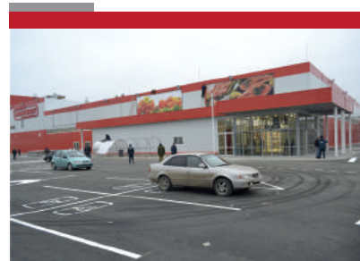
ГМ «Магнит» г. Георгиевск 6696 м2