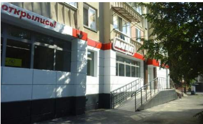
ММ Дзинага, г. Владикавказ 454 м 2