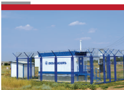
«Волс Самара-Тихорецк- Новоросийск»